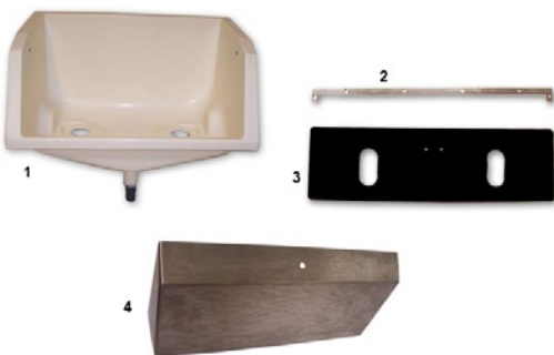
PU-Wanne für ToroX